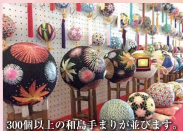
300個以上の和島手まりが並びます。